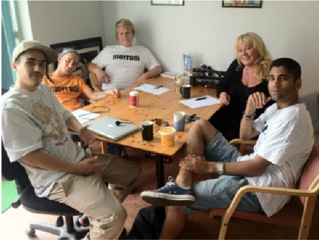
Mote på ID kontoret