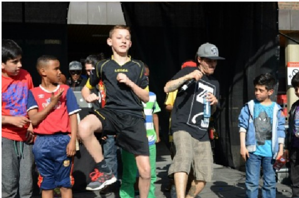
Mini-Morradi på Tøyen 2014