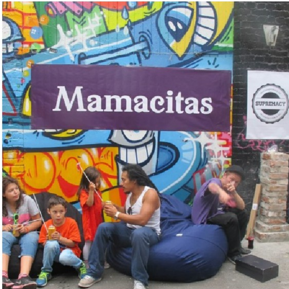
Fra Mamacitas sommerjam 2014